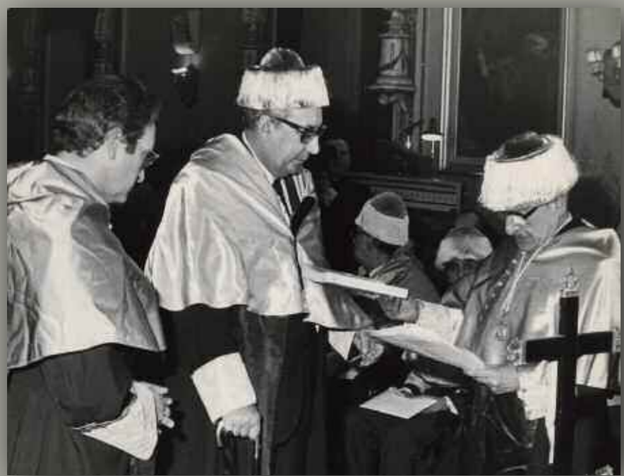
En xaneiro de 1980, Álvaro Cunqueiro, Camilo José Cela e o lingüista alemán Joseph M. Piel recibiron o título de Doutor Honoris Causa pola Universidade de Santiago de Compostela

Tras unha longa e dolorosa doenza, Cunqueiro falece o 28 de febreiro de 1981, pouco despois do susto da tentativa de golpe de estado do 23-F. Os seus restos son trasladados a Mondoñedo o 1 de marzo, día de san Rosendo, patrón da vila.