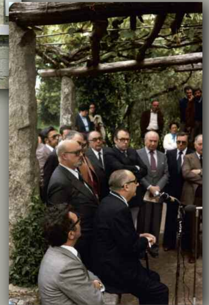
Entrega do Pedrón de Ouro en 1980

Álvaro Cunqueiro é un dos escritores galegos máis traducidos