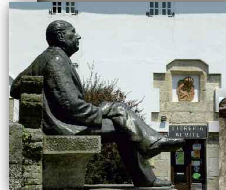
Unha escultura de Cunqueiro de Juan Puchades contempla xa por sempre a catedral de Mondoñedo e dende a súa atalaia espera as mil primaveras que han facer renacer Galicia