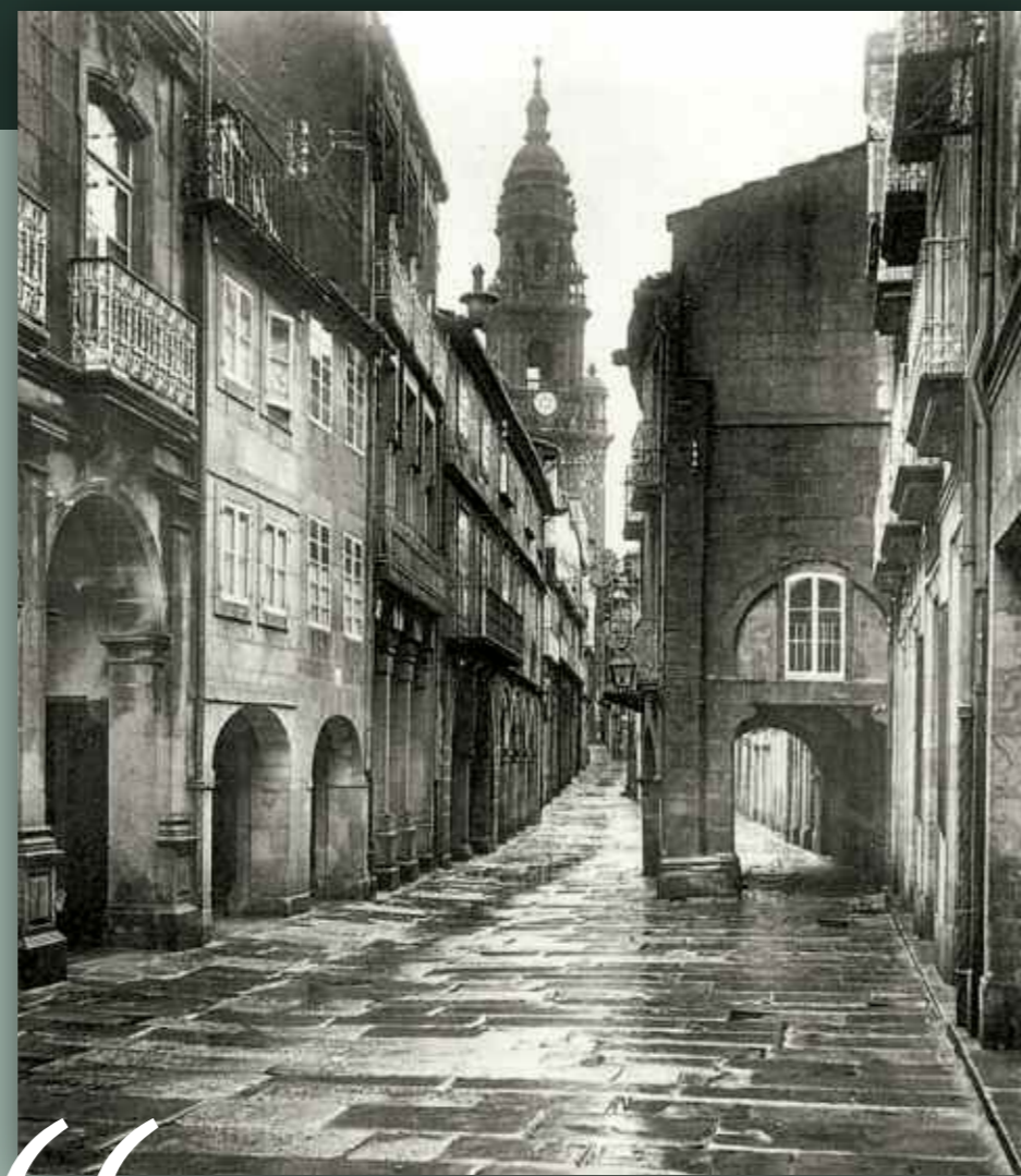
Rúa do Vilar

“Nos meus anos de mocidade, nunha tasca da rúa da Raíña, coa taza de ribeiro na man e o suave lentor vivaz doutras na mente, pensei máis dunha vez que podía escribir de Compostela, e dicir as súas maravillas coma ninguén”.