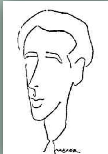
Cunqueiro visto por Carlos Maside

No outono de 1927, Cunqueiro chega a Santiago de Compostela para estudar Filosofía e Letras, carreira que nunca chegará a rematar. A cidade marcará o seu primeiro período de formación. Francisco Fernández del Riego comentou que “a súa